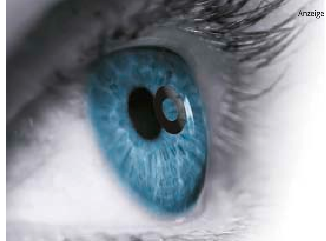
Das Kamra-Inlay wird in die obere Hornhautschicht eingesetzt.

Das KAMRA-Inlay: Keine Lesebrille mehr! 20 Millionen Menschen in Deutschland leiden unter altersbedingter Weitsichtigkeit. Jeder kennt